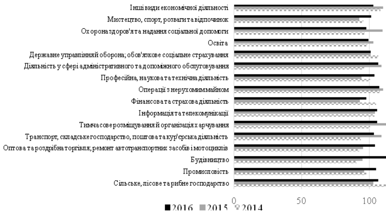
Рис. 1. Динаміка індексів фізичного обсягу ПП в 2014—2016 роках (до попереднього року), %.

Продуктивність праці є тим критерієм, який дає можливість на макrorівні визначити ефективність використання трудових ресурсів країни. В основі його зростання лежить збільшення обсягів ВВП, що в свою чергу, визначається ефективністю його формування в різних сферах економічної діяльності. Чим ефективніше працюють галузі економіки, тим більше створюються ґрунтовніші передумови зростання ПП, якості життя громадян, економіки країни в цілому. Тому в статті проаналізуємо існуючу динаміку ПП за ВЕД, базуючись на розрахункових даних (рис. 1) [8].